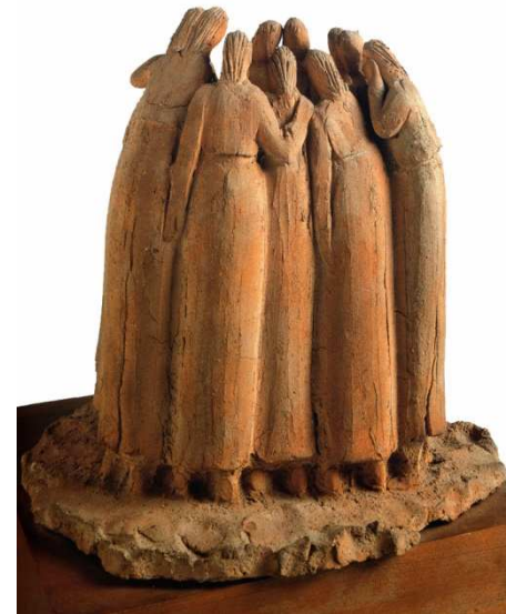
Arturo Martini, Le collegiali

Avaliação como processo colegial, agregador